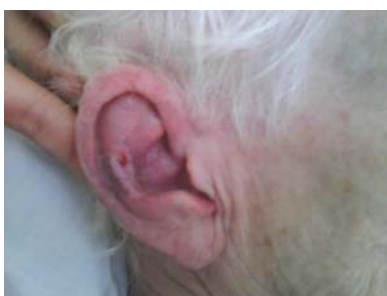
30-10-09. Evolución a 15 días tratamiento local + SEMPCARE VISCO 700