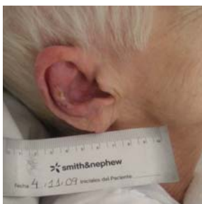
4-11-09 Úlcera cicatrizada