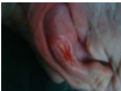
13-10-09. Úlcera por presión en oreja