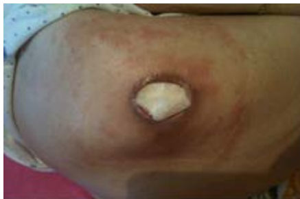
Evolución a los 3 días.