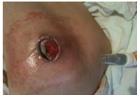
Aplicación de NO- STING SKIN- PREP