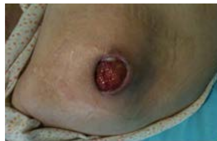
Evolución a los 12 días