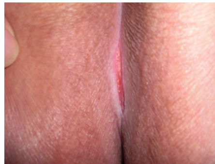
Evolución a los 3 días