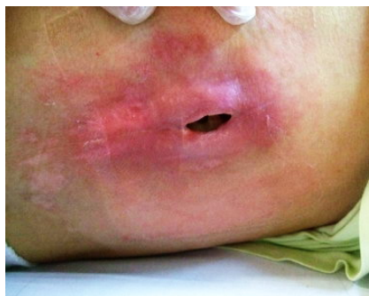
17/11/10. Dehiscencia profunda en zona dorsal