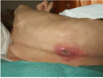
24/11/10. Disminución de la profundidad.