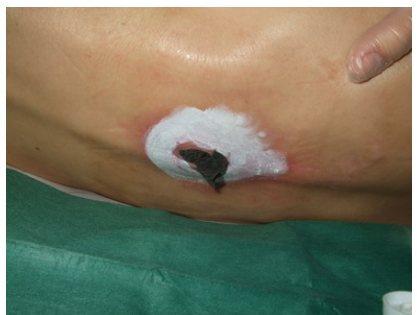
17/11/10. Aplicación ACTICOAT FLEX y TRIPLE CARE EPC