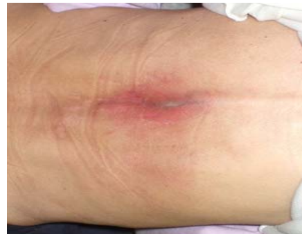
27/01/11. Cierre completo de la lesión