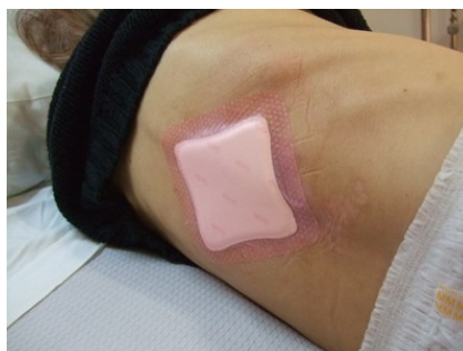
17/11/10. Aplicación de ALLEVYN GENTLE BORDER