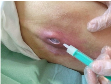
Aplicación de CATRIX con INTRASITE GEL