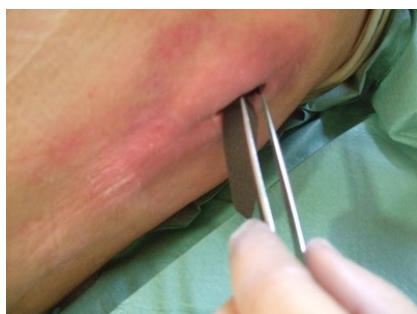
17/11/10. Aplicación ACTICOAT FLEX