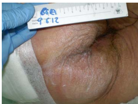
09/06/12. Aplicación tras 25 días de tratamiento.